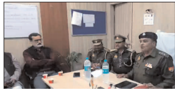
कोतवाली नगर परिसर में गणमान्य नागरिकों के साथ पीस कमेटी की बैठक करते सीओ सिटी।

अपराधियों के चिह्निकरण एवं आम जन में सुरक्षा की भावना उत्पन्न करने के उद्देश्य से थाना जलेसर पुलिस द्वारा थाना जलेसर क्षेत्रांतर्गत मिश्रित आबादी वाले क्षेत्रों में ड्रोन से सर्वे करते हुए सुरक्षा व्यवस्था का जायजा लिया गया। ड्रोन कैमरे की मदद से घरों की छतों की चेकिंग की गई। अवागढ़ क्षेत्रांतर्गत मिश्रित आबादी वाले क्षेत्रों में ड्रोन से सर्वे करते हुए सुरक्षा व्यवस्था का जायजा लिया गया। ड्रोन कैमरे की मदद से घरों की छतों की चेकिंग की गई।