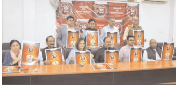
ताज महोत्सव समिति के अंतर्गत आयोजित अखिल भारतीय कवि सम्मेलन का राजा बलवंत सिंह एजुकेशन समिति सभागार में पोस्टर जारी करते संस्था के पदाधिकारी।