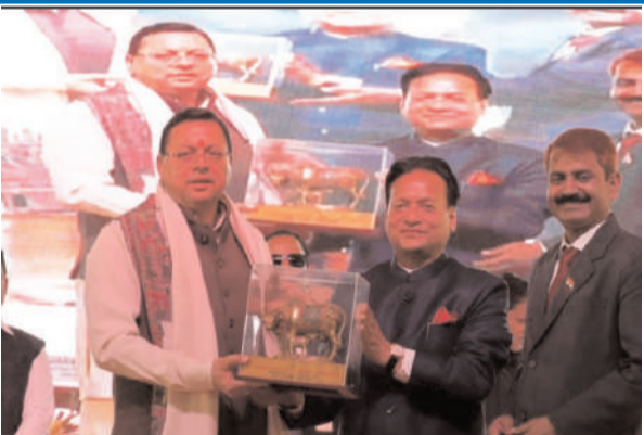
सम्मेलन में 16 देशों के वैज्ञानिक कृषि महाकुंभ में कर रहे हैं प्रतिभाग : कुलपति

पन्त नगर (उत्तराखंड)। विभिन्न योजनाओं, नवाचारों एवं प्रशिक्षणों के माध्यम से उत्तराखंड सरकार राज्य के किसानों को प्रशिक्षित करने का काम कर रही है। इस बार के बजट में 463 करोड़ रुपये का किसानों और पशुपालकों के उत्थान के लिए अलग से प्रावधान किया गया है। उक्त उद्धार मुख्यमंत्री पुष्कर सिंह धामी ने पंतनगर के गोविंद बल्लभ पंत कृषि एवं प्रौद्योगिकी विश्वविद्यालय में आयोजित '17वें कृषि विज्ञान सम्मेलन' में बतौर मुख्यअतिथि प्रतिभाग करते हुए व्यक्त किए। मुख्यमंत्री ने कहा कि यह गर्व का विषय है कि कृषि क्षेत्र के आधुनिकीकरण एवं कृषकों का उत्थान सुनिश्चित करने के उद्देश्य से इस प्रतिष्ठित सम्मेलन को देवभूमि उत्तराखंड की पुण्य धारा में आयोजित किया जा रहा है। ऐसे सम्मेलनों के द्वारा जहां एक ओर किसान भाइयों को कृषि से जुड़ी नवीनतम तकनीकों, शोध परिणामों एवं उन्नत बीज-खाद आदि के विषय में जानने का अवसर प्राप्त होता है, वहीं दूसरी ओर यहाँ पर लगे विभिन्न स्टाँलों के माध्यम से उन्हें औद्योगिकी, पशुपालन एवं जैविक खेती जैसी