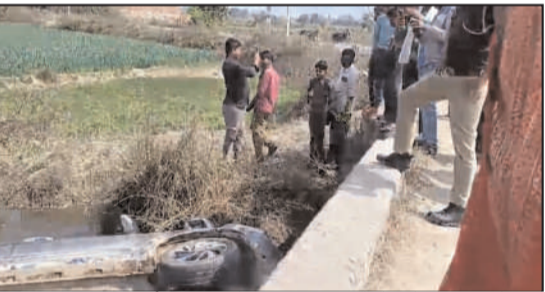
अलीगंज कपिल मार्ग पर खड्ड में पलटी कार को देखते क्षेत्रीय लोग।