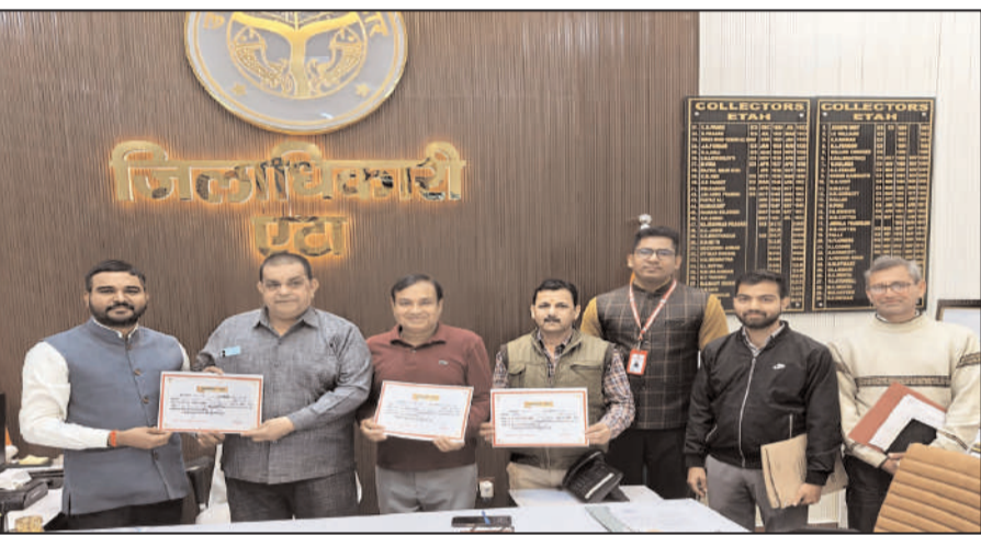
कलक्ट्रेट परिसर स्थित डीएम कार्यालय में 3 शस्त्र लाइसेंस निरस्त कराने वालों को प्रशस्ति पत्र देते डीएम।