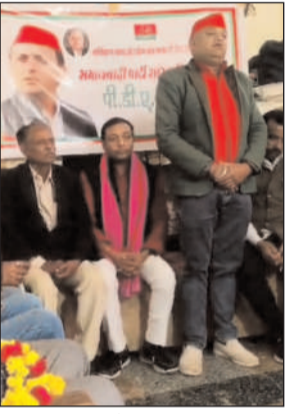
आगामी चुनावों की रणनीति बनते हुए पीडीए के सदस्य।