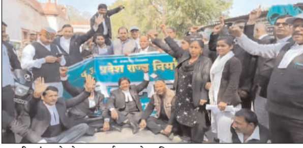
अपनी मांग को लेकर प्रदर्शन करते अधिवक्ता।

की मांग की। अधिवक्ताओं का कहना है कि सरकार अधिवक्ता अधिनियम में संशोधन कर उनके अधिकारों को सीमित करने जा रही है। उन्होंने इसे