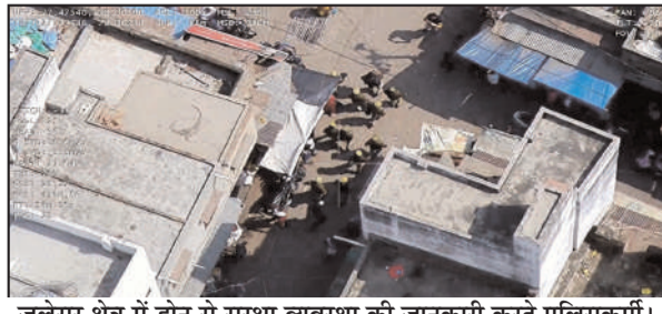
जलेसर क्षेत्र में ड्रोन से सुरक्षा व्यवस्था की जानकारी करते पुलिसकर्मी।