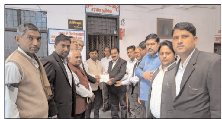
हसिल अलीगंज परिसर में एसडीएम को सीएम के नाम ज्ञापन सौंपते हुए अधिवक्तागण।

दो प्रतिशत अधिवक्ताओं की कल्याणकारी योजनाओं पर खर्च किया जाए जैसा केरल सरकार द्वारा किया जा रहा है। इसके अलावा नियम बनाने का अधिकार पूर्व में जो एडवोकेटस एक्ट में प्राविधानिक था उसको उसी प्रकार रखा जाए। केन्द सरकार द्वारा रेगुलेशन बनाने की जो बातें कही गई हैं उसे तुरन्त समाप्त किया जाए। साथ ही किसी प्रकार के संशोधन की आवश्यकता न होने के कारण हम अधिवक्तागण एडवोकेटस